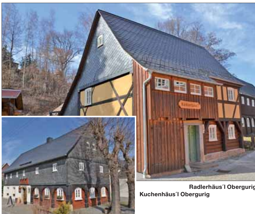
Radlerhäusl Obergurig Kuchenhäusl Obergurig

am 18. April startet der 25. Mönchswalder Berglauf, ein kreisoffener Ranglisten- und Volkssportlauf mit unterschiedlich langen Strecken. Beginn ist 17.30 Uhr an der Oberguriger Turnhalle. Die Zahl der Aktiven hat zugenommen, im letzten Jahr waren es etwa 130