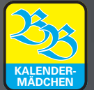
Sara, 20 Jahre aus Pulsnitz