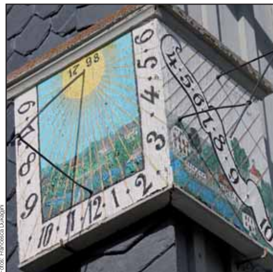
Nr. 6 „Beim Schiertzducker“ an der Sohlander Straße 50

nicht lange jüngste Sonnenuhr bleiben: Schon für 2013 ist die nächste Sonnenuhr geplant. Jürgen Walter vom Dorfclub Taubenheim erwägt deshalb nun eine Art „Redaktionsschluss“ für die Aufnahme weiterer Sonnenuhren in den Flyer und die Wanderroute, denn eine ständige Aktualisierung wird aus organisatorischen Gründen nicht möglich sein. Immerhin 15 der geplanten 22 Säulen stehen nun auch schon. Für das Anbringen der nächsten Infotexte wartet Taubenheim nun auf einige trockene Tage.