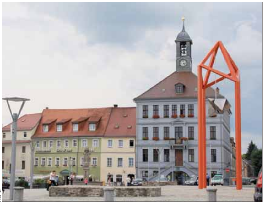
Die Sanierung der Innenstadt von Bischofswerda ist bald abgeschlossen.

Maßnahmen im öffentlichen und privaten Bereich investiert. Nunmehr steht mit Abschluss der Sanierung die gesetzlich vorgeschriebene Abrechnung des Sanierungsgebietes Bischofswerda „Innenstadt“ an. Die Stadt sei verpflichtet, Ausgleichsbeträge von den Grundstückseigentümern zu fordern. Viele Grundstückseigentümer hätten bereits Fördermittel über die Stadtansanierung abgerufen und erhalten.