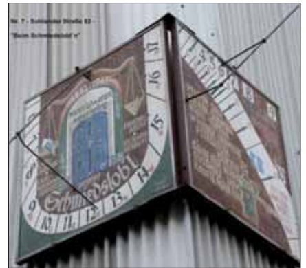
Nr. 7 „Bei Schmiedslobl'n“ in der Sohlander Straße 82