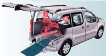
Bei einer Rollstuhlbeförderung werden die original vorhandenen Sitze bzw. Doppelsitzbank nach vorne geklappt bzw. herausgenommen.

Der Citroën Berlingo ist ein komfortables und vielfältiges Fahrzeug. Durch seinen geräumigen Innenraum bietet er die optimale Basis für ein behindertengerechtes Fahrzeug. Mittels der API Flexi Ramp kann das Fahrzeug je nach Bedarf verwendet werden. Bei einem Rollstuhltransport können drei weitere Personen Platz finden. Wird kein Rollstuhl befördert, so können fünf Personen mitfahren und zusätzlich der geräumige Kofferraum verwendet werden.