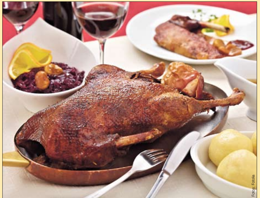
Traditionell wird die Gans in Deutschland mit Rotkohl und Semmelknödeln oder Kartoffelklößen gegessen.