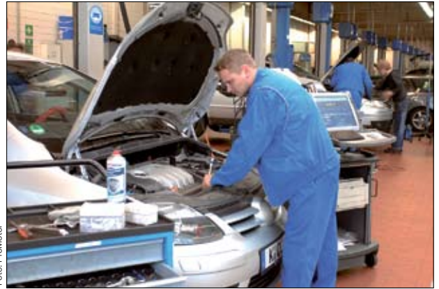
Vor der Fahrt in den Frühling braucht das Auto eine Kur.