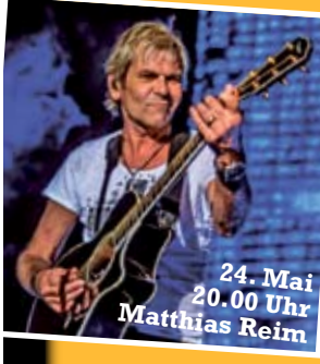
24. Mai 20.00 Uhr Matthias Reim