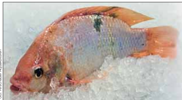
In Kirschau gezüchteter Buntbarsch (Tilapia)

Durchgehende Unterhaltungsmusik mit Moderation. Abends Party mit: