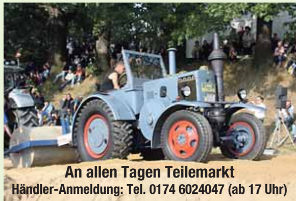
An allen Tagen Telemarkt Händler-Anmeldung: Tel. 0174 6024047 (ab 17 Uhr)

in Sohland an der Spree vom 19. bis 21.09.2014 auf dem Schützenplatz