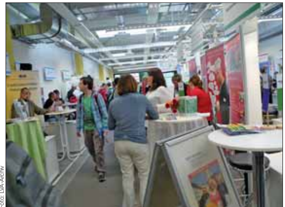
Viele Besucher beim Berufemarkt 2013

In diesem Jahr setzen die Aussteller besonders auf Mitmachangebote: Schülern soll anschaulich gezeigt werden, was sich hinter den Berufsbezeichnungen verbirgt und welche Anforderungen von den Unternehmern gestellt werden. Natürlich werfen die Vertreter der Unternehmen ein wachsames Auge auf die mitmachenden Schüler. Vielleicht ergibt sich ja der eine oder andere Ausbildungsvertrag aus dieser ersten Begegnung, oder wenigstens ein Schnupperpraktikum. Unternehmen haben noch Gelegenheit, sich als Aussteller des Berufemarktes anzumelden. (Kontakt: Madlen Deichmann, Tel.: 03578 3741-13, Fax: 0351 28027419, E-Mail: deichmann.madlen@