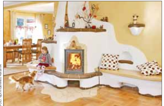
Behaglichkeit künstlerisch in Szene gesetzt: Die Kachelöfen von Inderwies laden mit ihren mollig warmen und organisch geformten Sitzbänken und Rückenlehnen zum gemütlichen Verweilen ein.

(ep) Ein Kachelofen ist der Inbegriff von Geborgenheit und Wärme. Schon Otfried Preußlers „Kleine Hexe“ saß während des Winters „tagaus, tagein auf der Bank vor dem Kachelofen und wärmte sich den Rücken“. Auch ihr Rabe Abraxas befand: „So lässt sich der Winter ganz gut aushalten“. Weil des Menschen Bedürfnis nach Geborgenheit und „Nestwärme“ zeitlos ist, sind auch Kamine und Kachelöfen nie aus der Mode gekommen. Zeitgemäße Feuerstätten, ausgestattet mit moderner Technik und inspirierend frisch im Design, stehen darum heute in knapp 15 Millionen Haushalten. Wahren Kennern und Liebhabern des faszinierenden Flammenspiels kommt nur ein echter Ka-