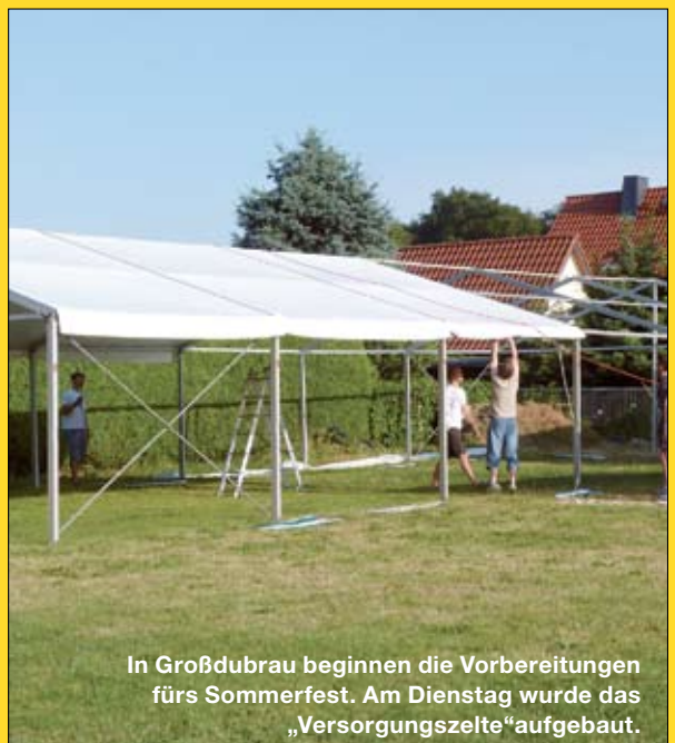
In Großdubrau beginnen die Vorbereitungen fürs Sommerfest. Am Dienstag wurde das „Versorgungszelte“ aufgebaut.