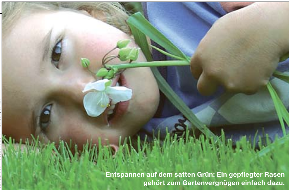
Entspannen auf dem satten Grün: Ein gepflegter Rasen gehört zum Gartenvergnügen einfach dazu.

Richter Mietstation • Gewerbering 3 • Tel. 035936 41411