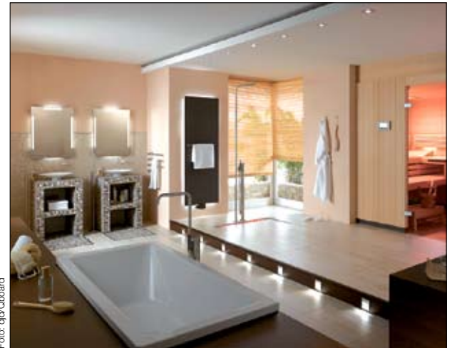
Von der Nasszelle zur Wellness-Oase: Eine umfassende Badmodernisierung muss nicht teuer und aufwendig sein.

Gerade für Renovierungszwecke sind die Fertigteile sehr gut geeignet. Die Platten lassen sich auf fast jedem Untergrund verwenden, ohne dass erst der alte Fliesenbelag entfernt werden müsste. Spezialwerkzeug ist dafür ebenfalls nicht notwendig: Die