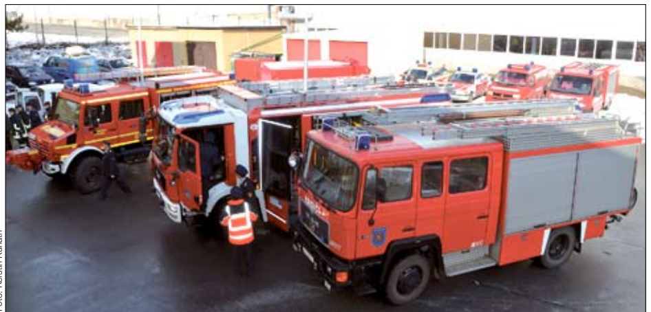
Die Fahrzeuge für Vilémov, Neukirch/Lausitz und Wilthen bei der offiziellen Übergabe am 9. Februar 2013 in Neukirch/L.

Mit dem Projekt wurde ein Meilenstein der Zusammenarbeit zwischen Feuerwehr, Rettungsdienst und Hochwasserschutz gesetzt. So hofft man, dass die moderne Technik nun auch zum Anreiz für weitere Jugendliche wird, in den ehrenamtlichen Dienst der FFW zu treten.