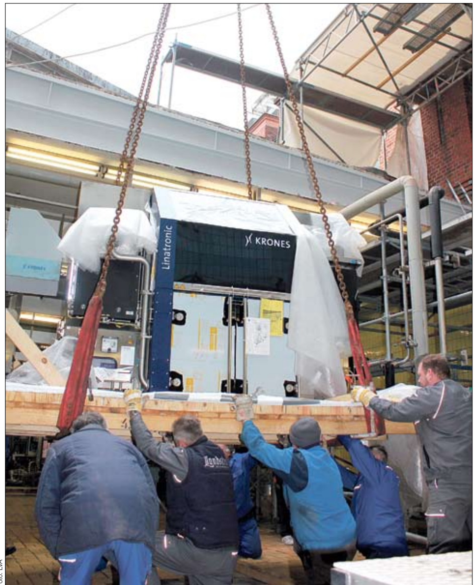
Neue Abfüllanlage für Landskron: Als erstes wurde das Aggregat zur Flaschenkontrolle durch das geöffnete Dach der Brauerei eingelassen.

Der Auszeichnung als „umweltfreundlichstes Un-