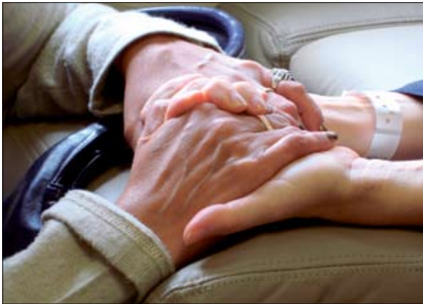
Ein Pflegefall tritt oft unerwartet ein und stellt eine Zerreißprobe für die Familie dar.