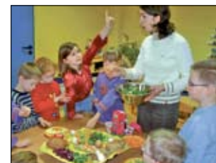
Kinder begeistern sich schnell für gutes Essen.