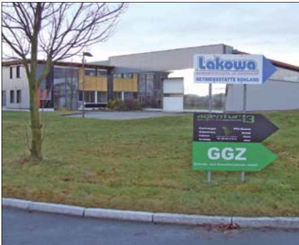
Das Gemeinde- und Gründerzentrum Wassergrund GmbH GGZ ist ebenfalls im Gewerbegebiet Wassergrund ansässig.

Erste Schritte zur Erschließung erfolgten durch beide Gemeinden