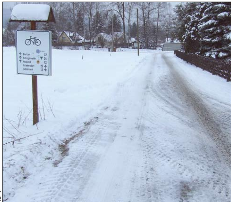
Schneereste auf Sachsen Straßen erhöhen Unfallrisiko