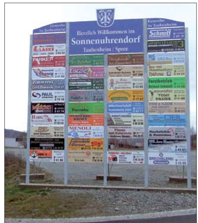
Sohland verdankt seine stabile Wirtschaftslage vor allem den regionalen Traditionsunternehmen