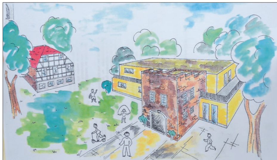
So soll die neue Wehrsdorfer Kita aussehen.