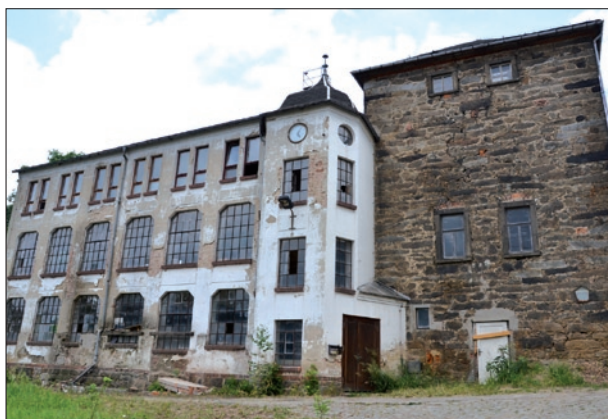
Der Bleichturm (rechts) wird in die neue Kita integriert.

Das Grundstück war erstmals um 1856/1858 baulich erschlossen worden, nachdem sich der Ort Wehrsdorf zum Zentrum der Leinenindustrie der Oberlausitz entwickelte. Später wurde das Gebäude u.a. als Knopf-